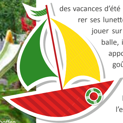
Le bateau de papier - Strasbourg Koenigshoffen

Adoptons ensemble, les bons gestes et les bonnes pratiques de l'été pour nos enfants.